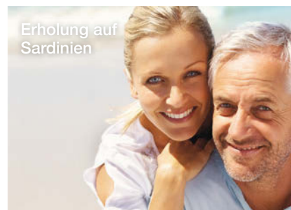
Erholung auf Sardinien

Nach einem letzten Frühstück in Ihrem 5★ Resort erfolgt der Transfer zum Flughafen und Rückflug nach Stuttgart. Individuelle Heimreise oder Sie nutzen den bequemen Transfer zu Ihrer Haustür (gg. Aufpreis).